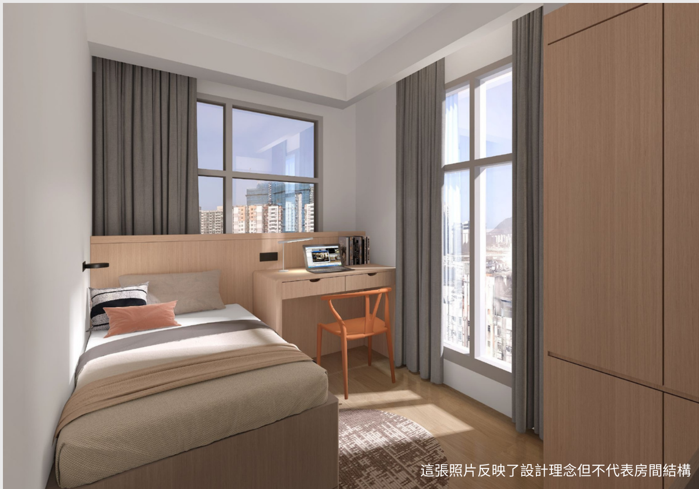
這張照片反映了設計理念但不代表房間結構